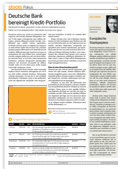
Textbox 67 x 40 mm CHF 400.-