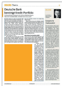
1/4 Seite hoch 97 x 130 mm CHF 600.-