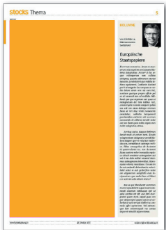
2/3 Seite hoch 137.5 x 258 mm CHF 1'500.-