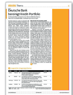
1/3 Seite hoch 36 x 258 mm CHF 750.-