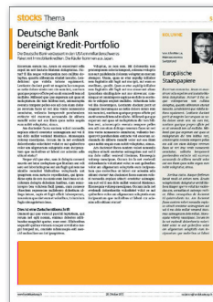
1/6 Seite quer 194 x 43 mm CHF 500.- / Frontseite: CHF 1'100.-