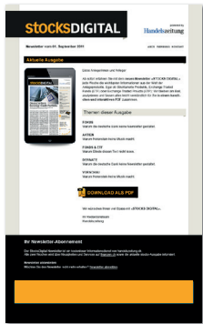
Leaderboard (Newsletter) 768 x 90 Pixel CHF 4'900.-