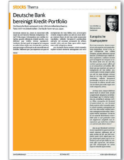
Junior Maxi Page 137.5 x 180 mm CHF 1'500.-