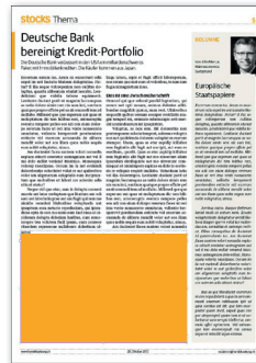
2 Spalten/ 90 mm hoch 137.5 x 90 mm CHF 700.-