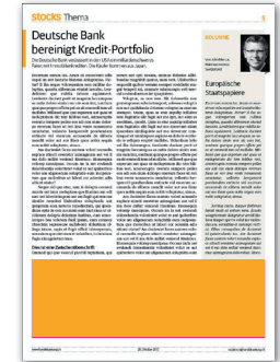
1/4 Seite quer 194 x 65 mm CHF 600.-