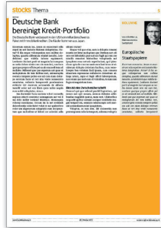
1/2 Seite 194 x 130 mm CHF 1'000.-